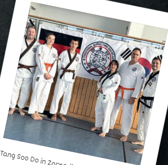
Tang Soo Do in Zorneding